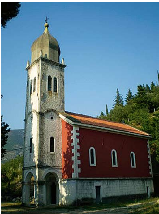
Pravoslavna crkva sv. Vaznesenja Hristova, 1870. godina

Uoči Prvog svjetskog rata Stolac je u skladu s elementima stolačkog etničkog mozaika imao tri nacionalne banke, te tri nacionalna kulturno-umjetnička društva: hrvatski "Napredak", muslimanski "Gajret" i srpsko društvo "Prosvjeta".