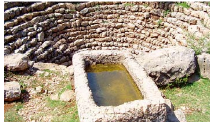
Bunar Neveš i kameno korito u Boljunima