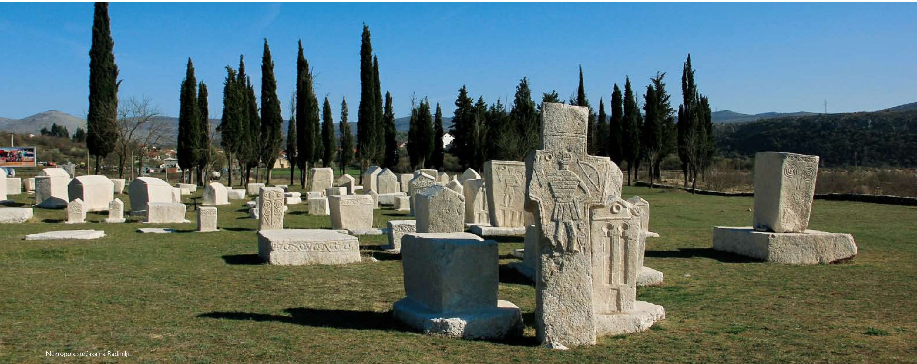
Nekropola stećaka na Radimlji