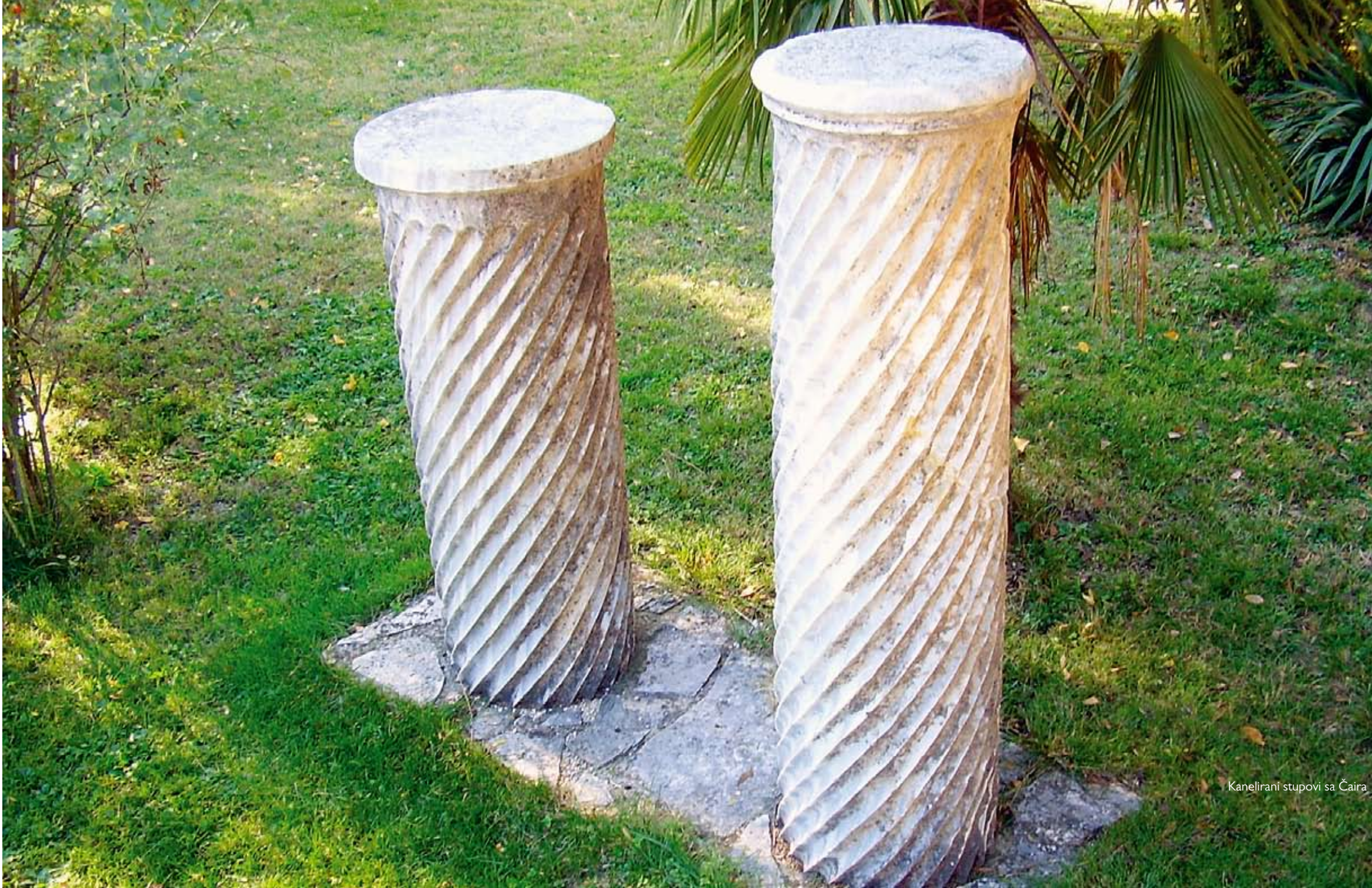
Kanelirani stupovi sa Čaira

Ratnički prodori barbarskih naroda od početka 4. do 6. st. na teritoriju Rimskoga Carstva donijet će znatne promjene u postojećoj antičkoj kulturi. U arhitekturi kasnoantičkog Stoca važno mjesto zauzima rimski castrum na kojem će se kasnije razviti srednjovjekovna utvrda Vidoški grad. Stolački castrum imao je sva obilježja tadašnjih gradskih utvrda izgrađenih na temeljima helenističke tradicije. Utvrda se sastojala od zidina visokih 10 metara koje su okruživale grad flankiranim tornjevima, čiji način gradnje ukazuje na razdoblje druge polovice 4. st., u vrijeme Valentijana I. (364.-375.). Nakon podjele Rimskog Carstva 395. godine, na Istočno i Zapadno, područje današnjega Stoca našlo se u graničnom dijelu Zapadnog Rimskog Carstva.