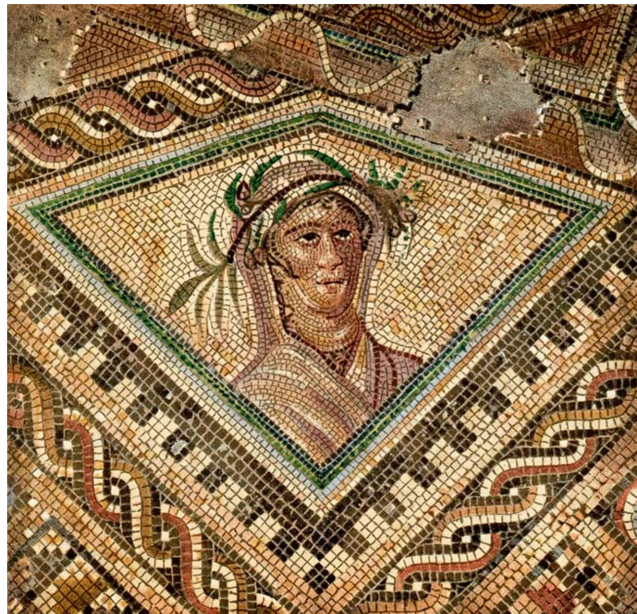
Hora proljeća - mozaik iz stolačke terme, druga polovica III stoljeća