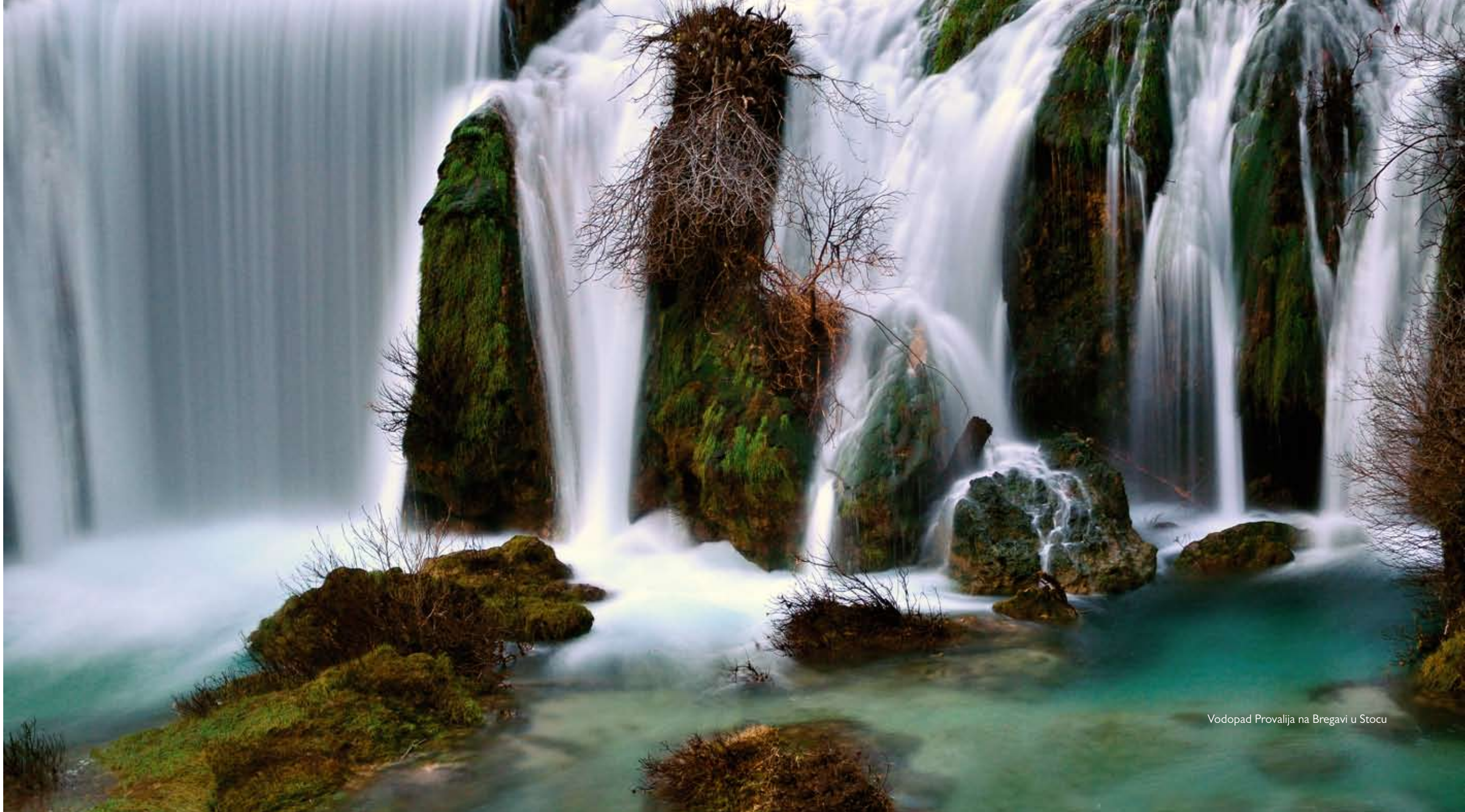
Vodopad Provalija na Bregavi u Stocu