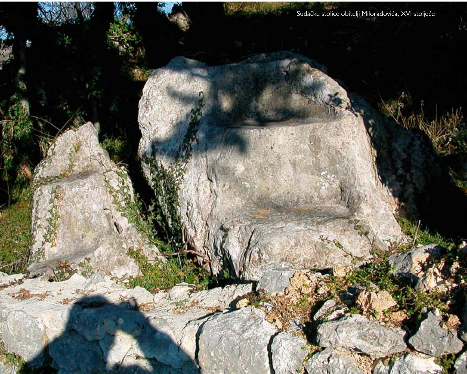
Sudačke stolice obitelji Miloradovića, XVI stoljeće