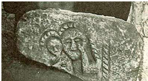
Gospa s malim Isusom - Vidoštak kod Stoca

Pop Dukljanin u svom čuvenom Ljetopisu navodeći u Humskoj zemlji župe, pored Stona, Popova, Zažablja, Luke, Veljaka, Imote, Gorice, Vecenigea, i Debra, navodi i župu Dubrava koja je zauzimala prostor s lijeve strane rijeke Neretve do današnjeg grada Stoca.