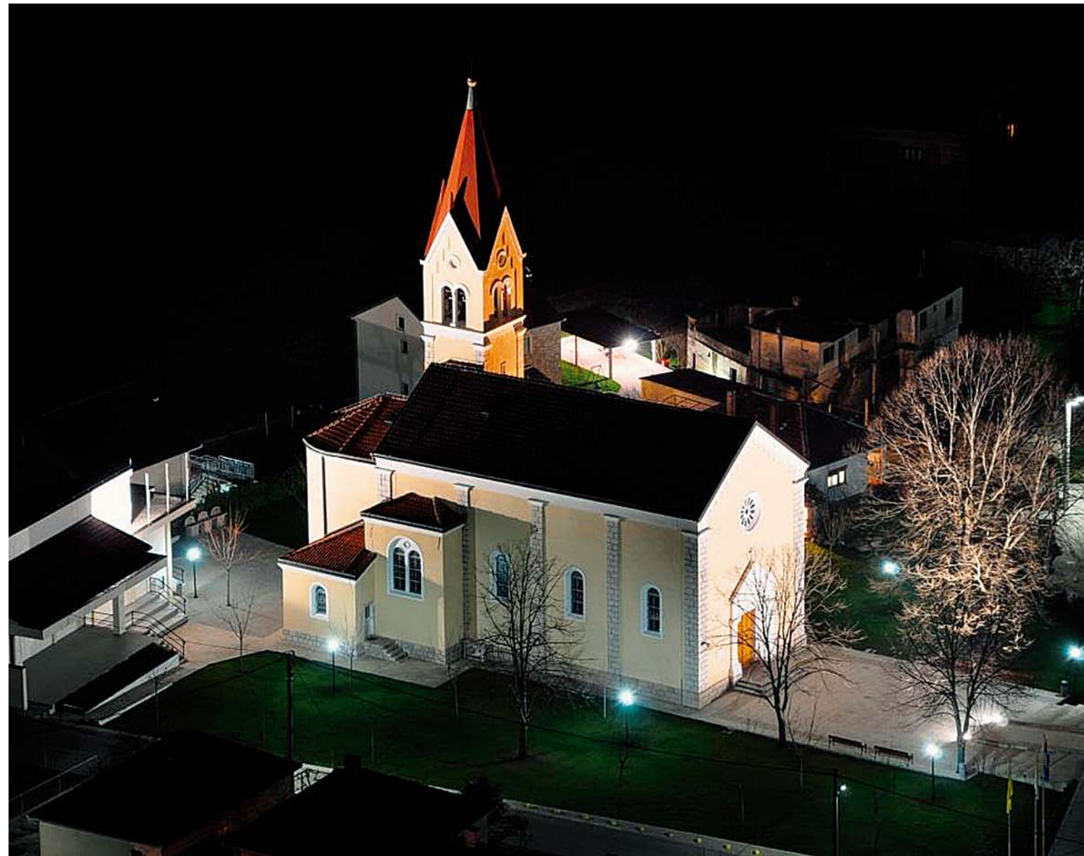
Katolička crkva sv. Ilije Proroka, 1902. godina