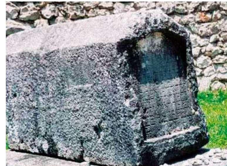
Grob rabina Moše Danona

koje imaju bašče, vinograde i svoje vode.” Nakon Karlovačkog mira (1699.) Vidoška je tvrđava proširena, te postaje jedna od najvećih utvrda u Hercegovini. Grad je imao 13 kula, snažne, 2 m debele, bedeme, te nekoliko stambenih i gospodarskih zgrada. Od 1761. godine do ukinuća kapetanija 1835., gradski kapetani su Rizvanbegovići. Za vrijeme vezirovanja najpoznatijeg Rizvanbegovića, čuvenog