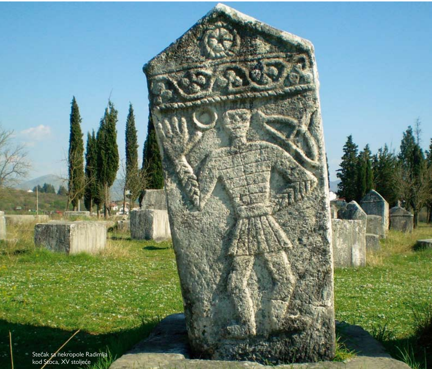
Strećak sa nekropole Radimlja kod Stoca, XV stoljeće