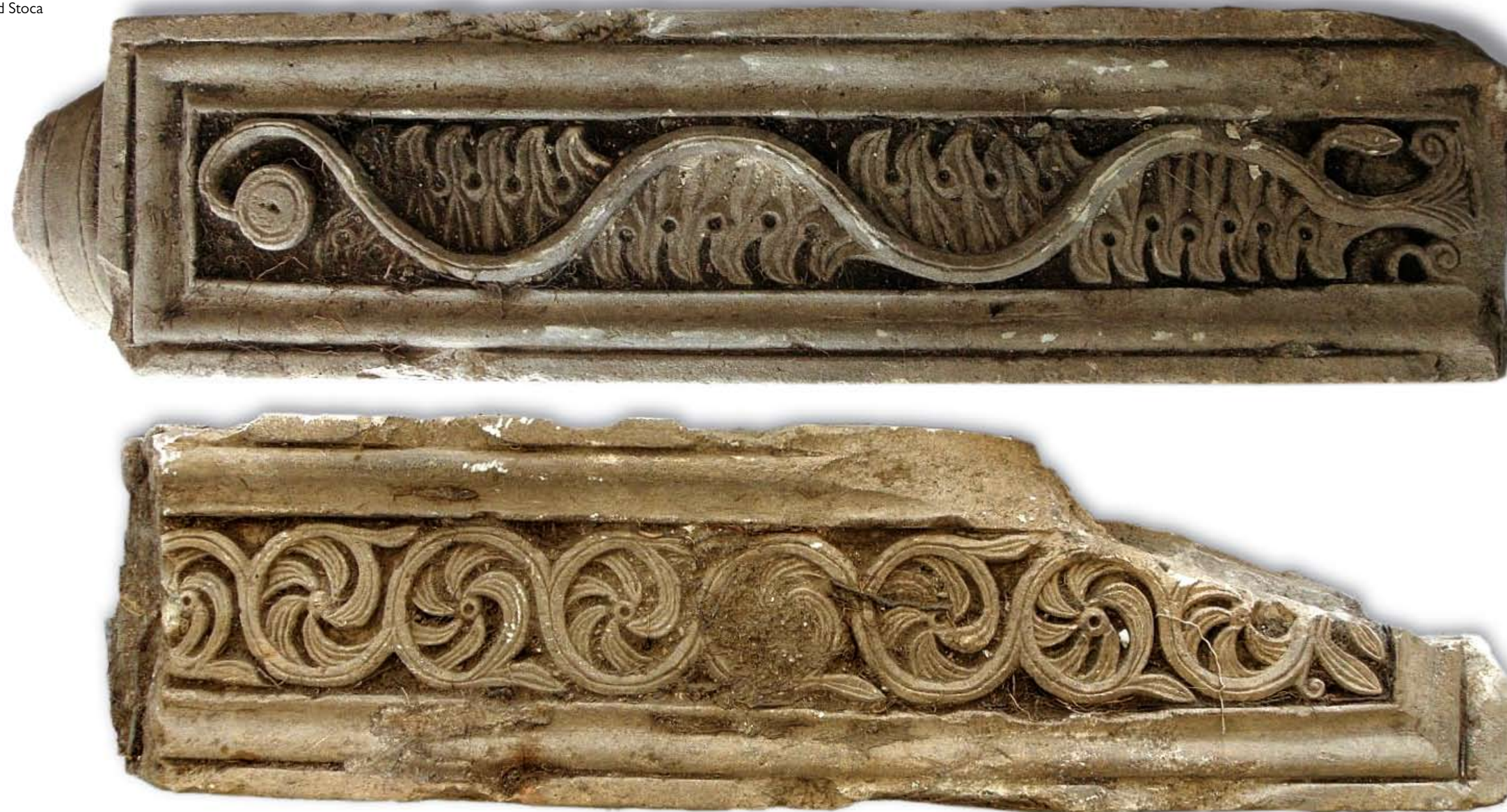
Pilastri oltarne pregrade na lokalitetu Crkvina - Rivine kod Stoca

Grad Koštur, dvadesetak kilometra sjeveroistočno od Stoca, pokraj sela Dabrica, izgrađen je u srednjem vijeku na ostacima rimske granične utvrde. Konstantin Porfirogenet u svojim spisima navodi ga 948. godine pod imenom Dabriskik. Zidine grada